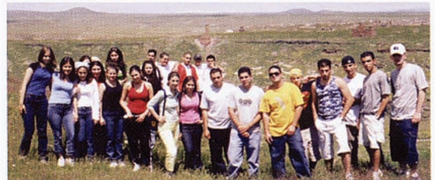
Գալիֆորնիոյ Մանուկեան-Տեմիրճեան վարժարանի աշակերտները Հայաստանի մէջ: