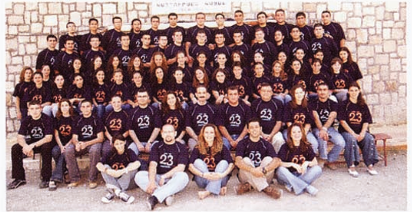
Հալէպի ՀԵԸԻ (Հայ Երիտասարդաց Ընկերակցութիւն) անդամները Միւրթեան Քեսապի ճամբարին մէջ, Սուրիա: