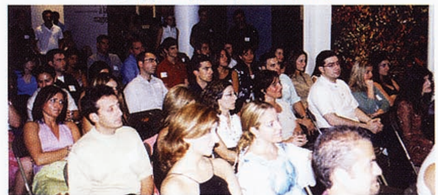
ՀԲԸՄԻ FOCUS ծրագրի, 2003-ի Մոնթրէալի մտահորիզոն ձեռնարկի ընթացքին, որ տեղի ունեցաւ քաղաքի ժամանակակից արուեստներու քանգարանի սրահներէն մէկուն մէջ: