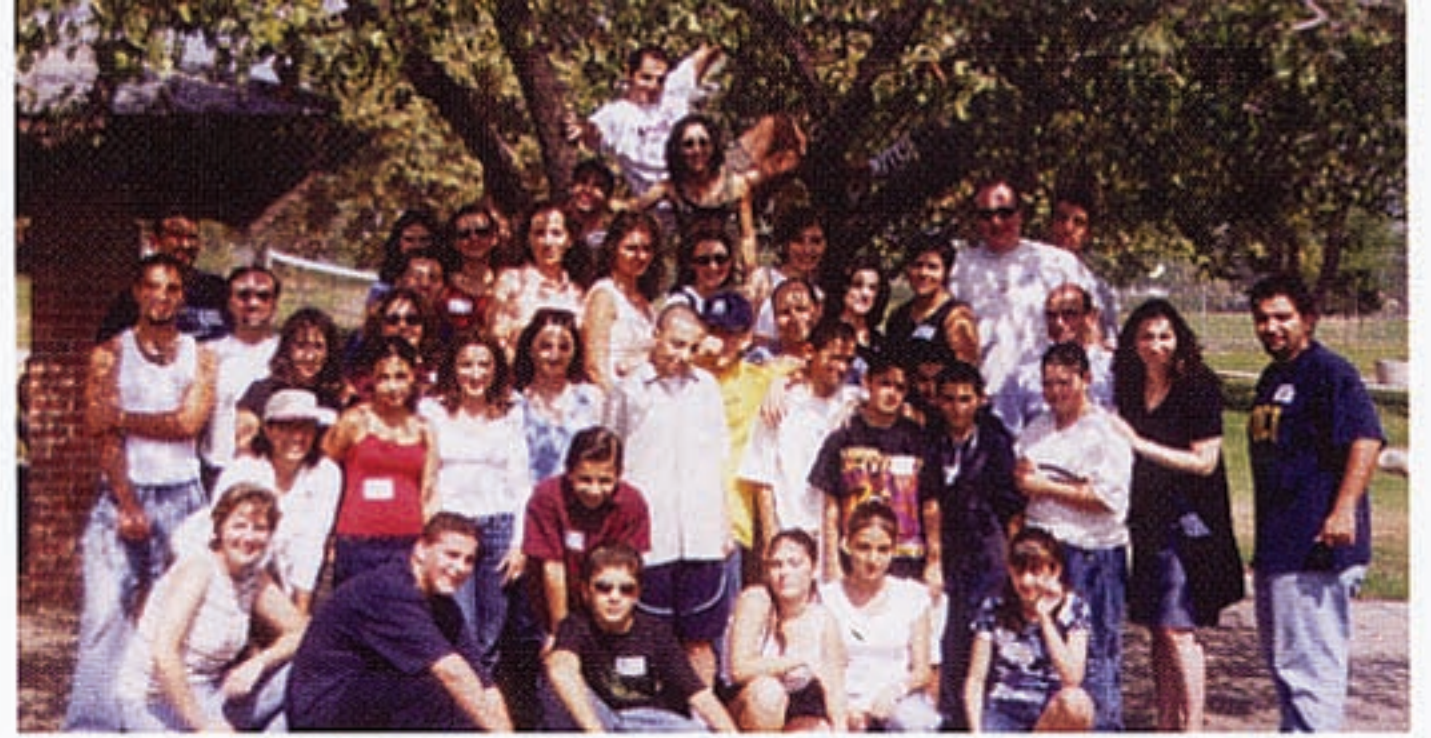
ՀԲԸՄԻ Յաջորդ Սերունդ ծրագրի խորհրդատուները, աշակերտներն ու պաշտօնէաները Լոս Անճելոսի մէջ:

Երիտասարդ հայորդիները ՀԲԸՄԻ երդիքին տակ իրենք զիրենք հարազատ օճախի մէջ կը զգան, միեւնոյն ժամանակ յագուրդ տալով իրենց բազմապիսի հետաքրքրասիրութիւններուն: