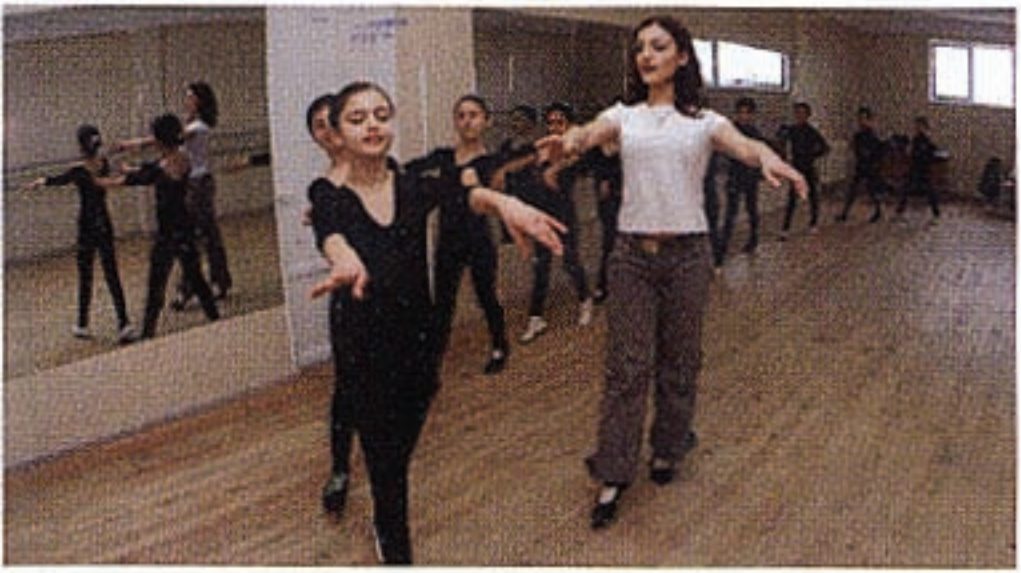
ՀԲԸՄի Հայորդաց Կեդրոններէն մէկուն մէջ աշակերտները իրենց պարուսոյցին հետ:

երաժշտութիւն, պարարուեստ ձեռառուեստ ու մարզանք: Երեք կեդրոններուն մէջ ալ մատուցուել կան, ուր ամէն շաբաթ եկեղեցական արարողութիւններ կը մատուցուին եւ Աստուածաշունչի ընթերցումներ կը կատարուին: