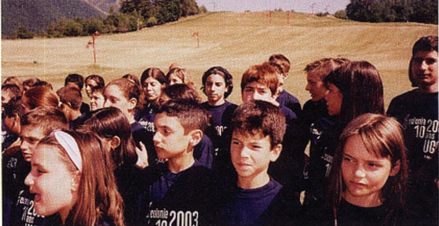
Ֆրանսայի (վերեւի նկար), եւ Ամերիկայի (ներքեւի նկար) ՀԲԸՄի ամառնային ճամբարներու մասնակիցներ: