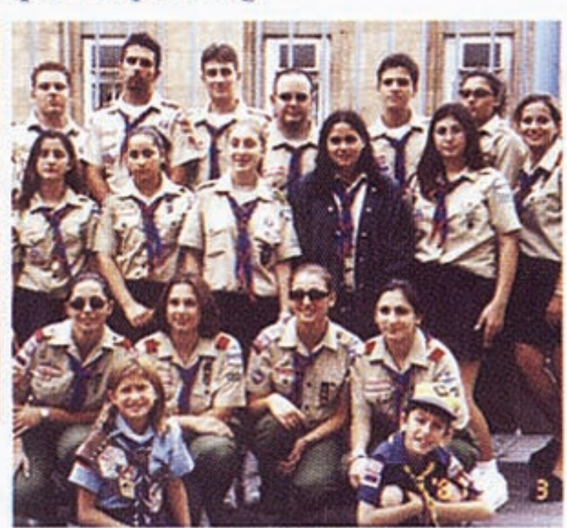
ՀԲԸՄԻ Սան Ֆերնանտոյի սկստուները: