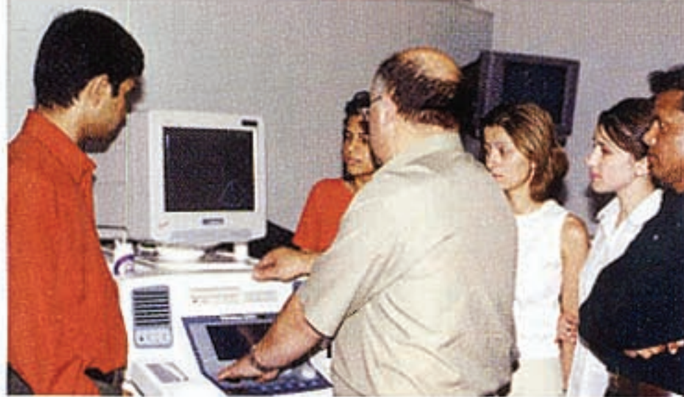
Գերձայնային Կեդրոնի աշակերտներ Հնդկաստանէն, Ռուսիայէն եւ Հայաստանէն, իրենց դասատուին հետ: