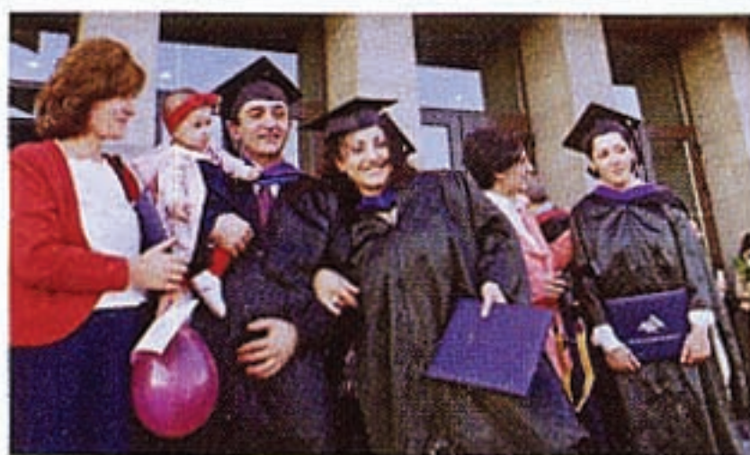
Հայաստանի Ամերիկեան Համալսարանի ուսանողները հանդերձ ընտանեօք կը տօնախմբեն իրենց շրջանաւարտութիւնը:

Մօտ տասը տարիէ ի վեր, Ամենայն Հայոց Կաթողիկոսութեան գործակցութեամբ, ՀԲԸՄը Հայաստանի մէջ կը հովանաւորէ երեք Հայորդաց Կեդրոններ Երեւանի մէջ: Նորքի, Արաբկիրի ու Մալաթիայի այս կեդրոնները ծառայութիւն կը մատուցեն ուսուցանելով երէխաներուն՝ պատմութիւն, համակարգիչներու գործածութիւն, արուեստ,