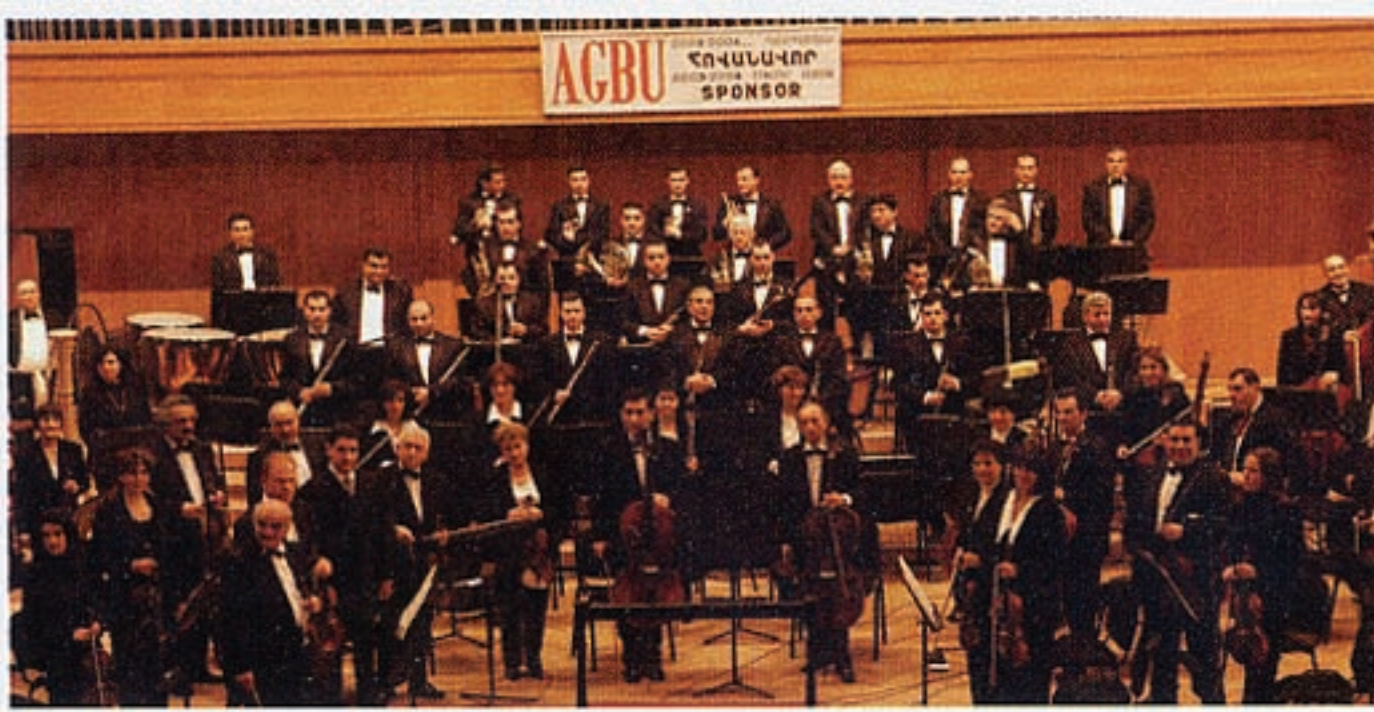
Հայաստանի Ֆիլհարմոնիք Նուագախումբ