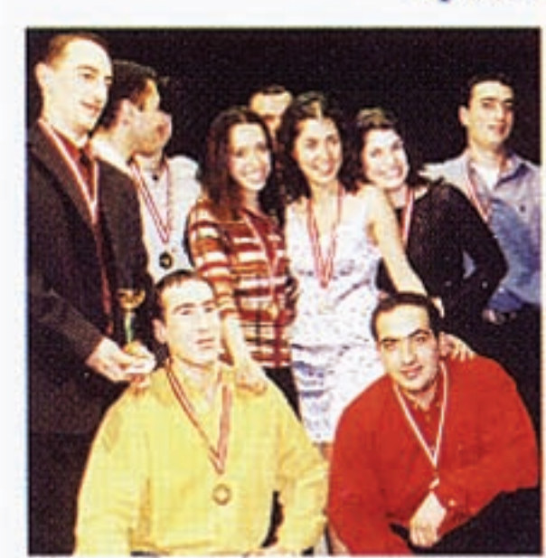
ՀԲԸՄԻ Երոպական 12-րդ խաղերու յաղթական մարզիկները, Վիեննա, Աւստրիա: