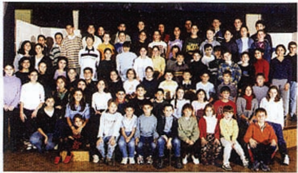
Փարիզի Ալեք Մանուկեան շարաբօրեայ վարժարանի աշակերտները: